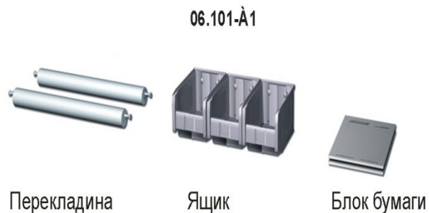
Рис.2 Дополнительные компоненты, артикул/общий вид

Для данного изделия, Вы можете приобрести следующие дополнительные компоненты (рис.2): 2 перекладины (с крепежом) в защитном кожухе, 3 пластиковых ящика с кронштейном для крепления к сетке, 2 блока бумаги А4.